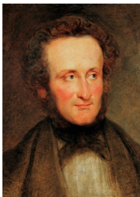
Alois II. z Lichtenštejna