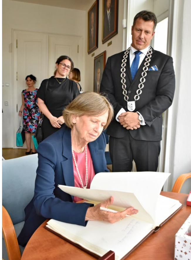
Princezna Nora na opavské radnici