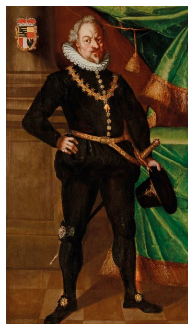
Karel I. z Lichtenštejna