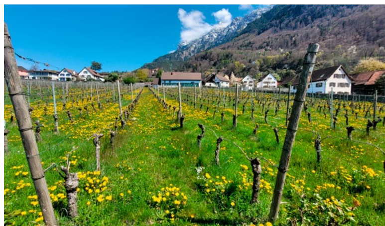
Jaro na knížecí vinici uprostřed Vaduzu