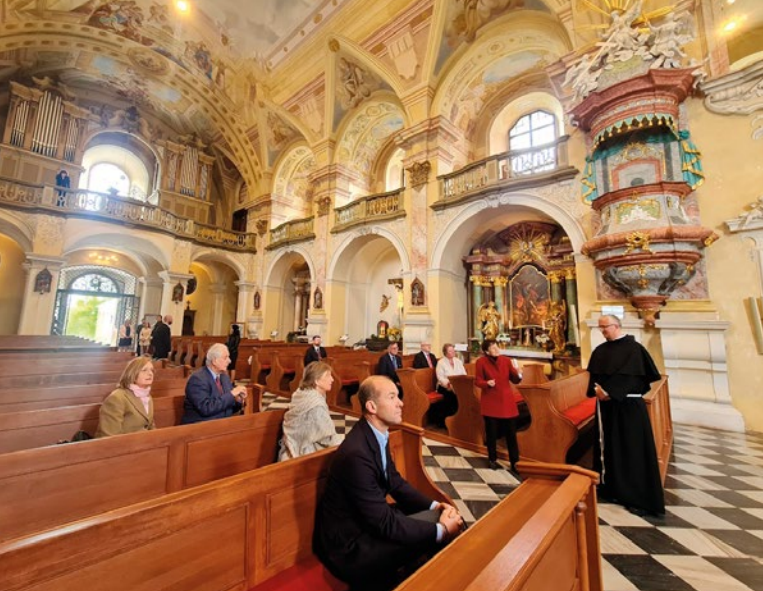
Knížecí rodina v poutním kostele na krnovském vrchu Cvilín