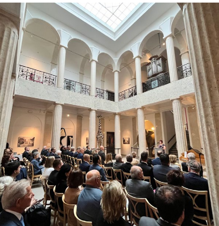
Slezské zemské muzeum

Po oficiálním uvítání se členové knížecí rodiny prošli historickým centrem Opavy, oživili rodinné vzpomínky