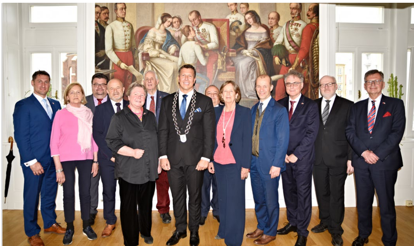
Privítání knížecí delegace na opavské radnici

Tři princezny a dva princové přijeli do Opavy na zahájení výstavy ve Slezském zemském muzeu, která mapuje 400 let působení tohoto šlechtického rodu na Opavsku a Krnovsku. Expozice „Knížata z Lichtenštejna. Páni země opavské a krnovské“ předkládá portréty knížat, dokumenty vztahující se k jejich opavskému působení nebo bojové zástavy a představuje tak návštěvníkům historický význam rodu při sjednocení a rozvoji regionu v předmoderním období. „Lichtenštejnskou výstavu v Opavě bez nadsázky pokládám za expozici století. Slezské zemské muzeum je úzce spojeno s osobností knížete Jana II. z Lichtenštejna vládnoucího na přelomu 19. a 20. století, díky jehož filantropické velkorysosti vzniklo a dostalo od svého zakladatele do vínku mnoho předmětů. Současná výstava navíc disponuje velkým množstvím uměleckých