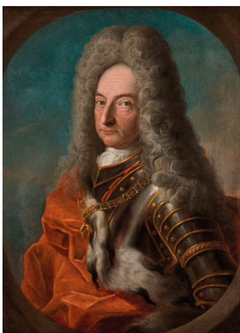
Antonín Florián I. z Lichtenštejna