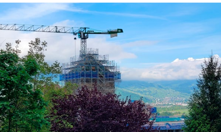
I symbol knížectví je třeba občas rekonstruovat

V té době bude ještě knížecí hrad s největší pravděpodobností pokryt lešením. Možná je to dobře. Stěží najít lepší symbol pro péči, s jakou se rod věnuje udržování historického dědictví. Nejen svého, ale i našeho. V Lichtenštejnsku stejně jako ve střední Evropě. Za své peníze. Udržitelně. Odpovědně. ■