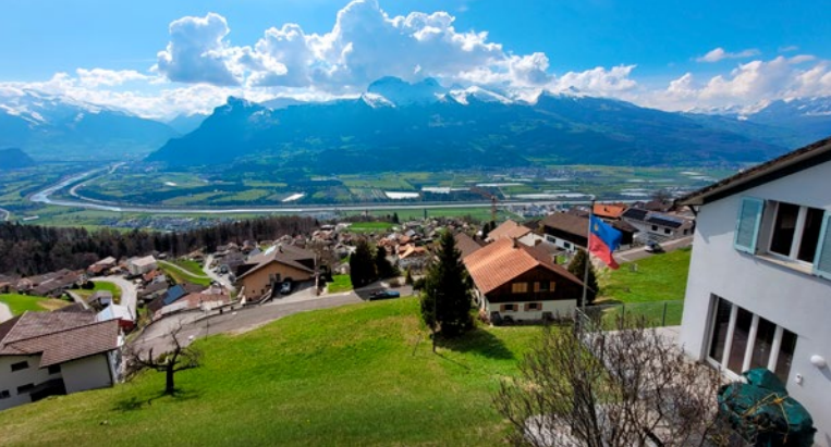
Rýn při stoupání do Alp