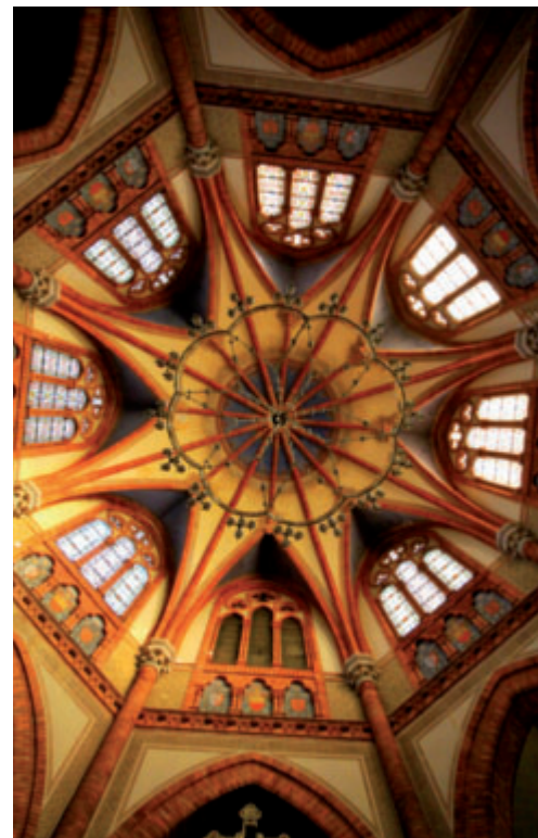
Kopule kostela v Poštorné, jehož výstavbu financoval kníže Jan II. z Lichtenštejna